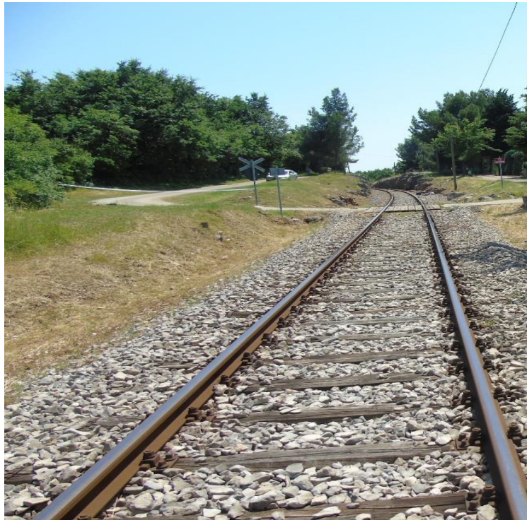
Slika 1. – ŽCP „Stancija Grgur“

U navedenoj ozbiljnoj nesreći smrtno je stradao vozač osobnog cestovnog vozila te je zabilježena veća materijalna šteta na osobnom cestovnom vozilu i manja materijalna šteta na putničkoj garnituri.