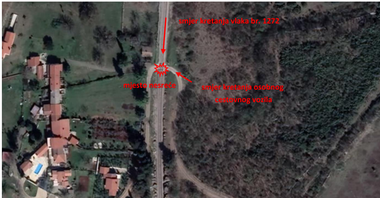
Slika 2. – Mjesto nesreće

U nesreći je smrtno stradao vozač koji je upravljao osobnim cestovnim vozilom. U osobnom cestovnom vozilu nije bilo drugih putnika.